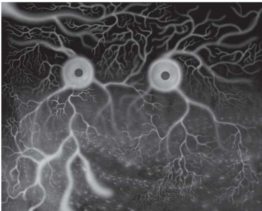
«П. Шаматрин. Глазки. 2005»

Хочу выразить благодарность своей любимой семье, которая во всём была и остаётся для меня примером; своей супруге, поддержавшей меня в укреплении веры в собственные необычные воспоминания; её подруге, изначально подтолкнувшей к более ускоренному и тщательному обращению к уголкам памяти, хранившим эту информацию, и конечно же соавтору, реализовавшему процесс рождения данной книги, которая если бы и появилась, то не так быстро и не в таком качестве.