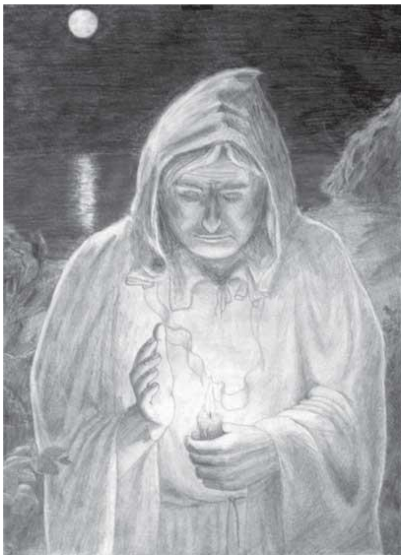
«А. Хохлатов. Монах. 1992. Карандаш»

Эту жизнь можно отдалённо сравнить с таким отпуском. И если ты зашёл в какой-то тупик, ситуация сама подскажет выход, а если подсказка не будет воспринята, путешествие будет прекращено свыше, оттуда виднее как лучше поступить. Поэтому беспокоиться за время своего ухода совершенно не стоит, а вот наслаждаться текущим воплощением и получать в нём максимальный опыт – это дело чести.